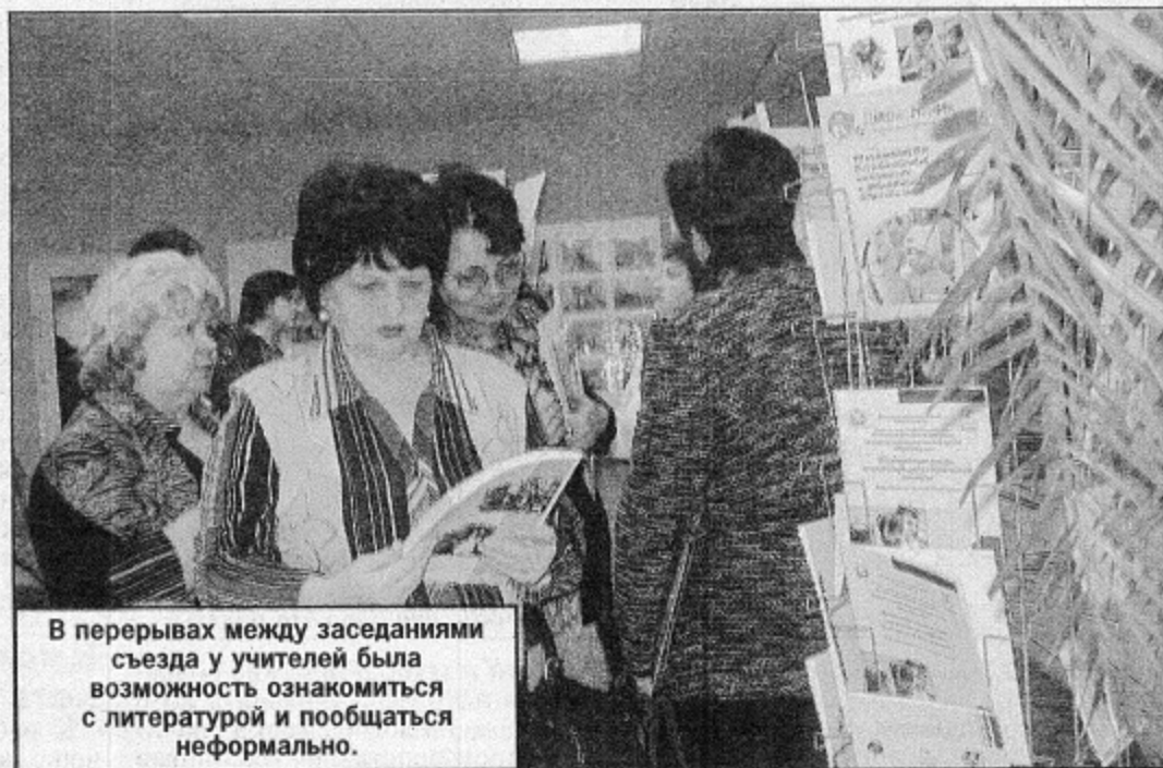
В перерывах между заседаниями съезда у учителей была возможность ознакомиться с литературой и пообщаться неформально.

коллегам из ТГПУ. Их должны знать в лицо учителя и школьники, – считает губернатор.