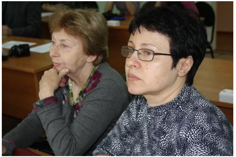
На фото: члены жюри Конкурса.

Подведение окончательных результатов Конкурса финала и представление лауреатов будет проводиться 26 апреля 2012 года в актовом зале ТГПУ в 15.00.