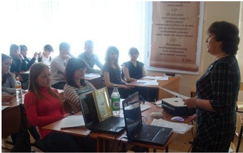
На фото: Фрагменты уроков финалистов.

С заданием справились все. Уроки получились интересные. Многие учителя использовали возможности групповой работы на уроке: работая в малых группах, ребята на время находили объяснение или решение общего для всех задания; на других уроках каждая группа выполняла своё задание.