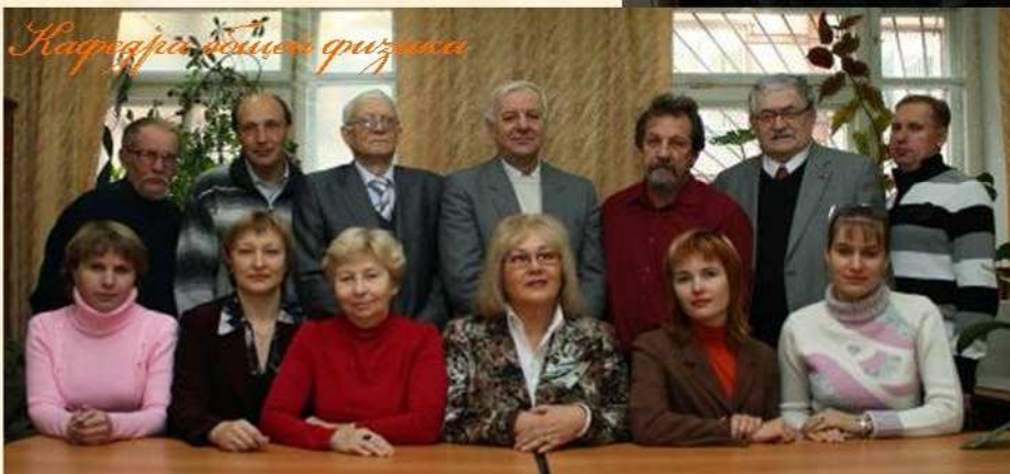
Кафедра общей физики

тета, его многолетней традицией является общественная активность студентов физмата. Сохраняя в себе полученный на факультете заряд бодрости, энергии, умения работать с людьми, многие выпускники сумели проявить себя на самых разных участках работы.