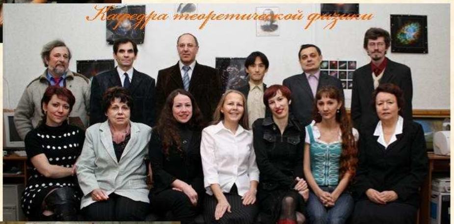
Кафедра теоретической физики

Сравнительно молодой является Кафедра информатики, ранее именовавшаяся Кафедрой технических средств обучения. Возникновение специальной кафедры, предметом деятельности которой являются средства обучения вообще, без обра-