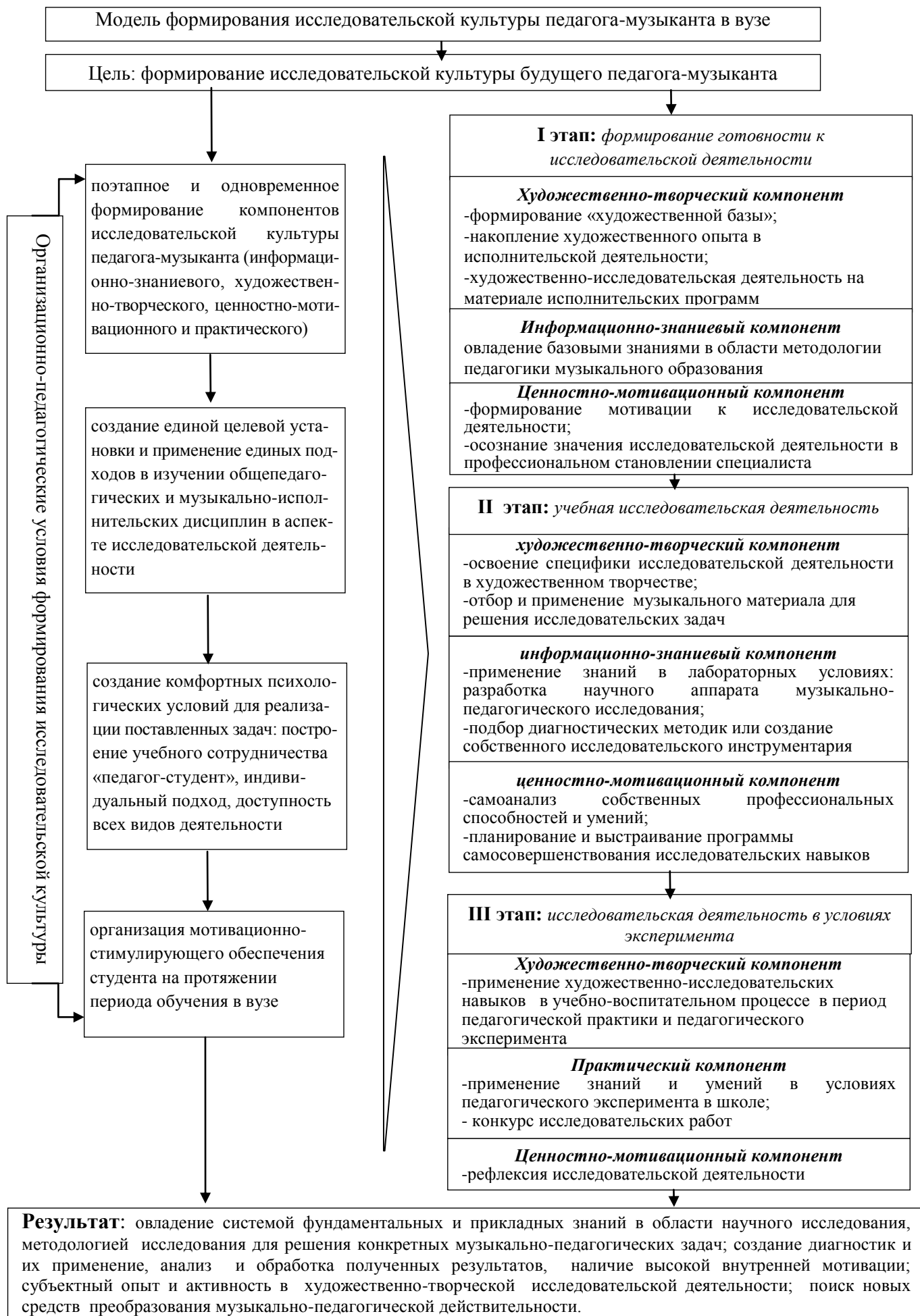
Рис.1. Целостная модель формирования исследовательской культуры будущего педагога-музыканта