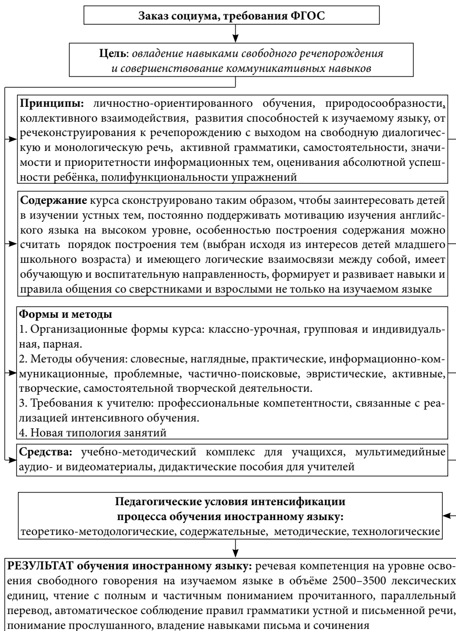
Схема 1. Модель интенсификации процесса обучения иностранным языкам в начальной школе