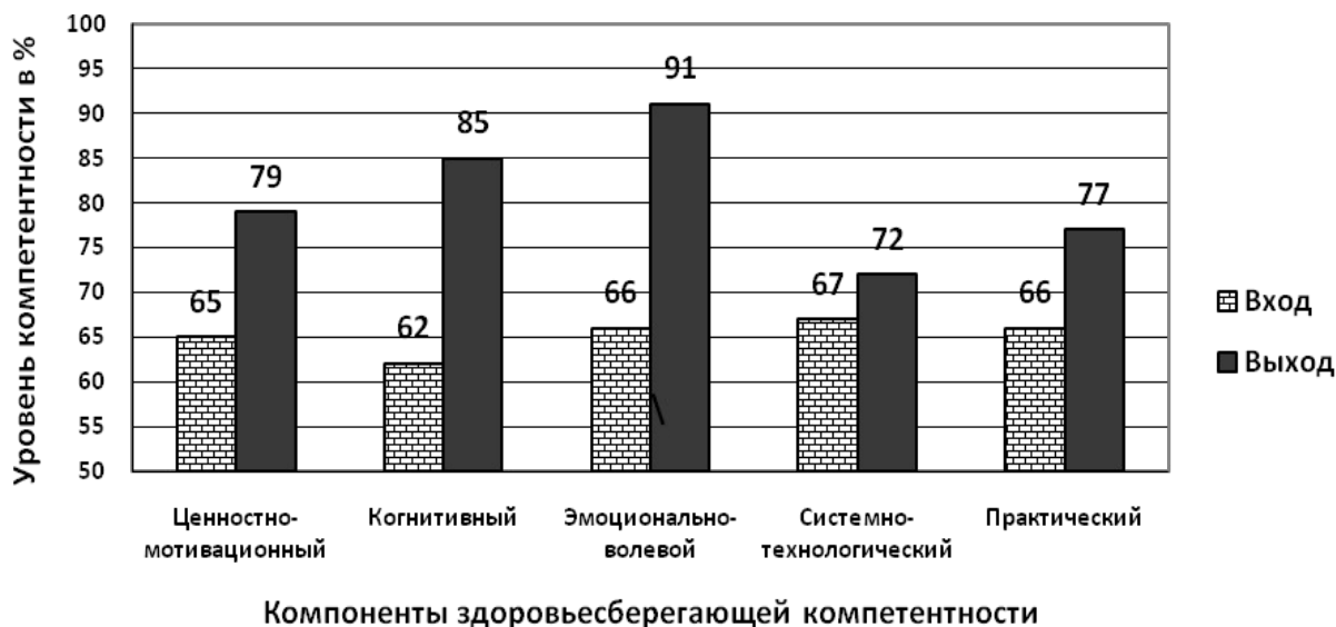
Рис. 4. Развитие здоровьесберегающей компетентности учителя в процессе повышения квалификации

профессионально-личностного здоровья учителя отслеживалась в течение пяти лет (2004-2009гг.) по программам «Здоровьесберегающие технологии в образовании» и «Система мониторинга качества здоровьесберегающей деятельности образовательного учреждения». Результаты приведены по данным одной группы численностью 26 человек (2007-2008 учебный год) на рис. 4.