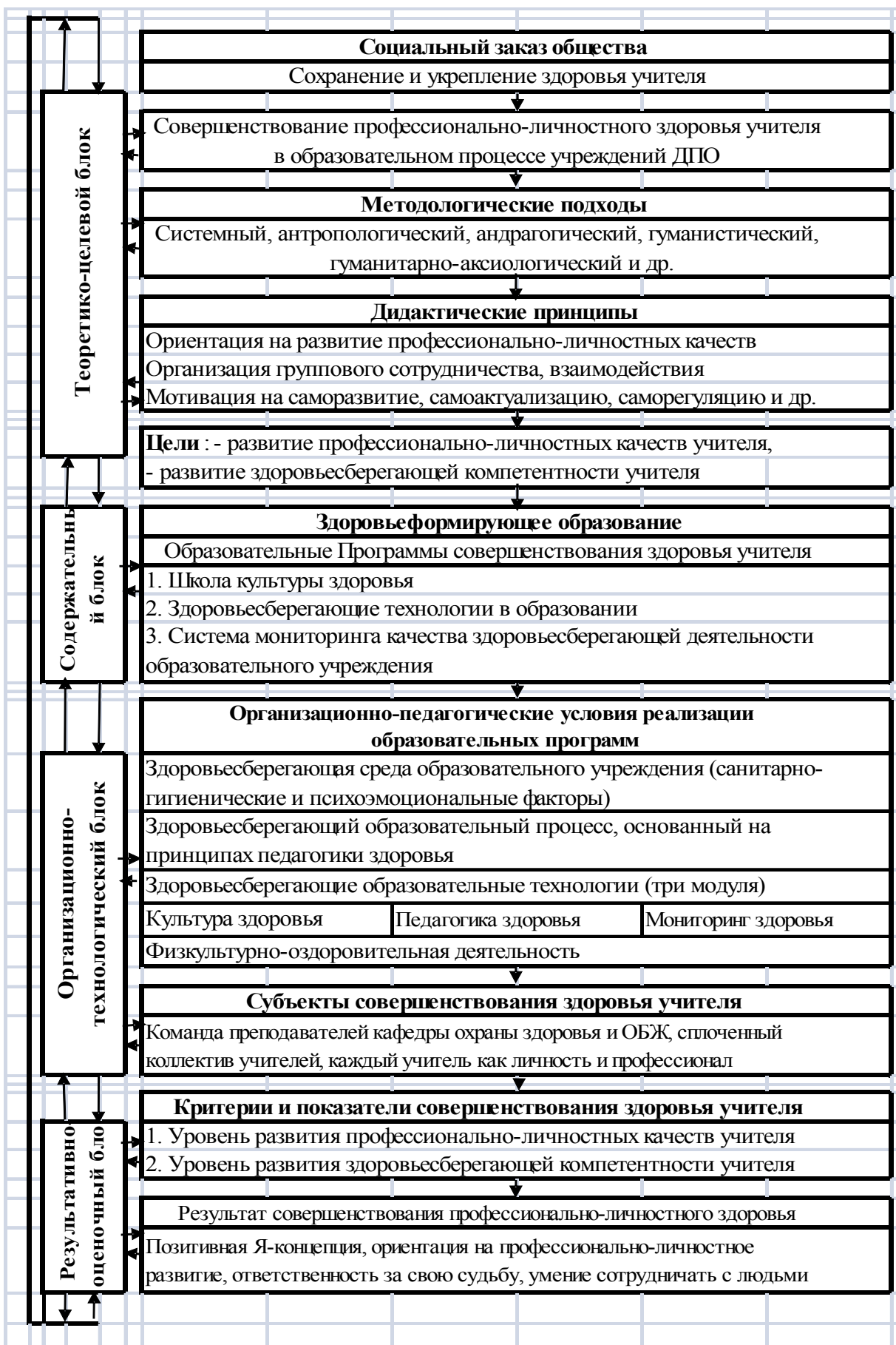
Рис. 1 Педагогическая модель совершенствования профессионально-личностного здоровья учителя в образовательном процессе учреждений ДПО