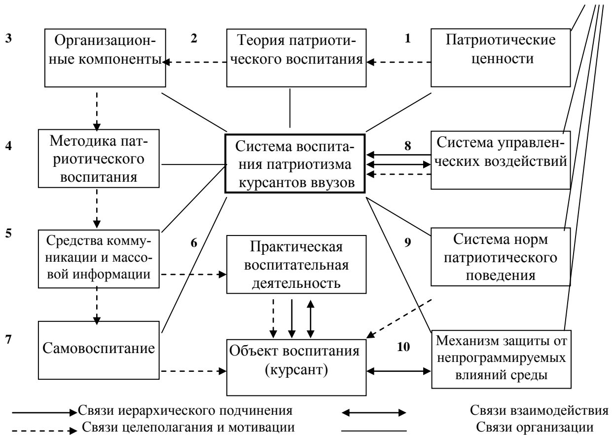
Схема 1. Теоретическая модель системы патриотического воспитания курсантов военных вузов

1. Отражает классовую (этническую, профессиональную) направленность воспитания. На основании общественной идеологии государство формулирует идеологический «заказ» на подготовку воина-патриота. «Заказ» формулируется в виде общегосударственных ценностей, поддерживаемых силой государственного авторитета. Включает патриотические ценности.