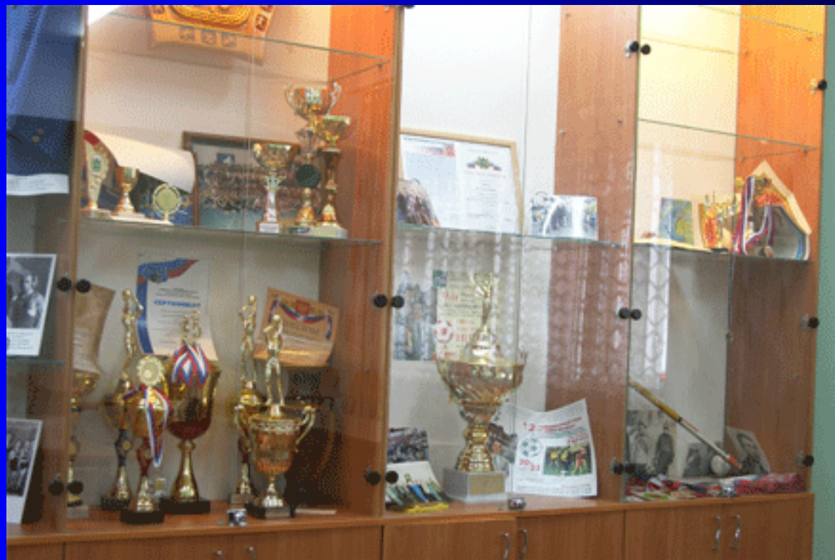
Музей истории спорта при факультете физической культуры (учебный корпус № 5)