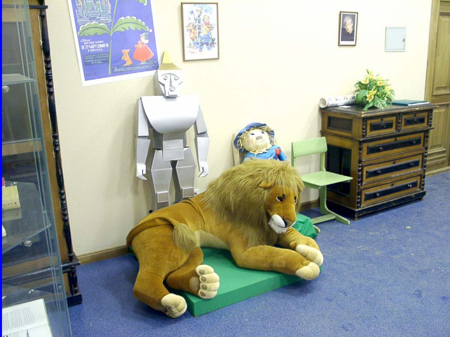
Экспозиция в музее А.М. Волкова