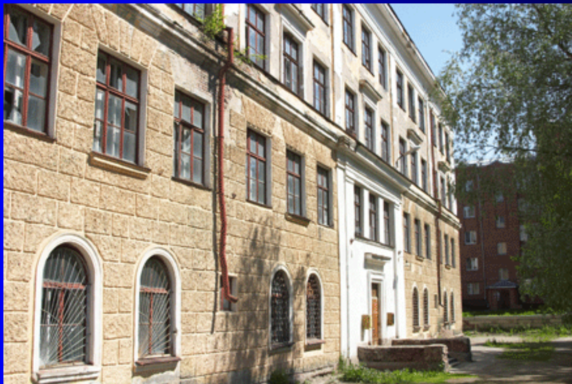
Учебный корпус № 4.