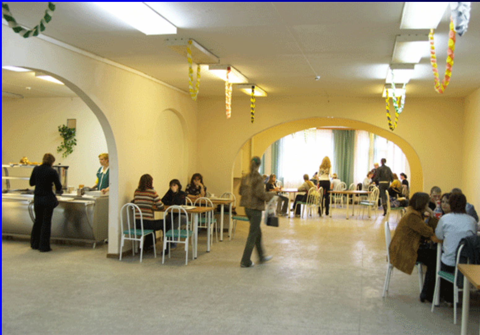
Столовая в учебном корпусе № 8.