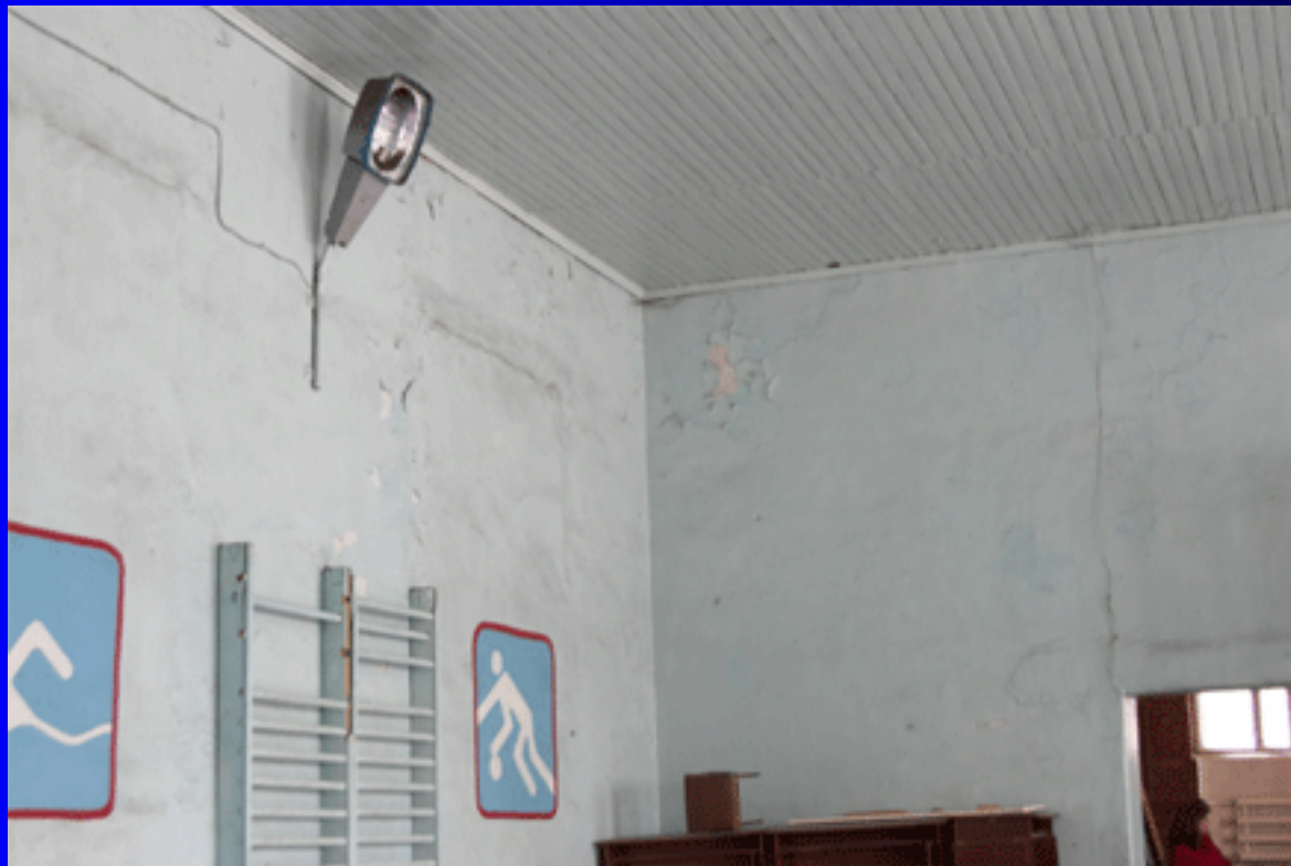
Легкоатлетический зал факультета физической культуры