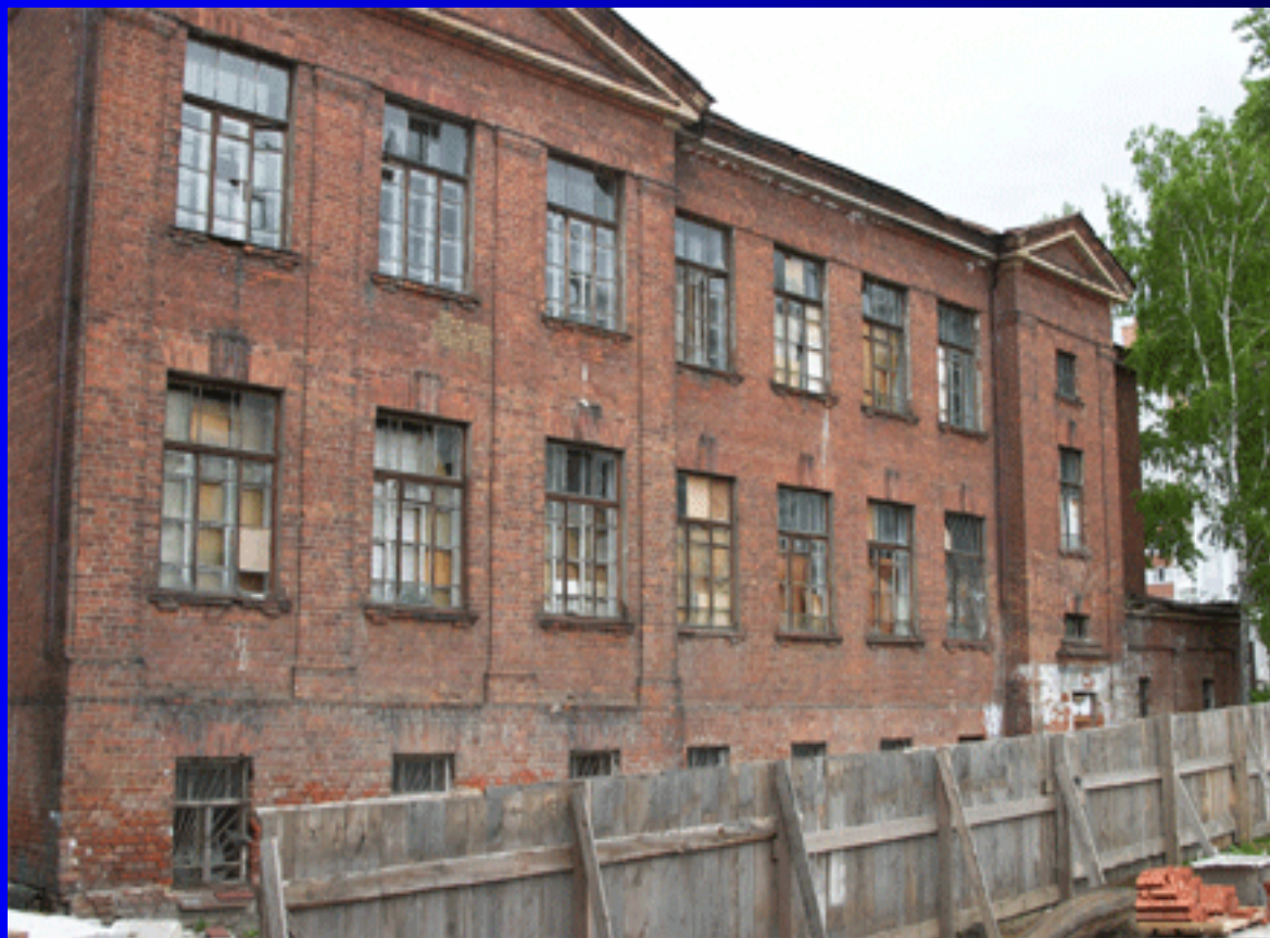
Учебный корпус № 3.