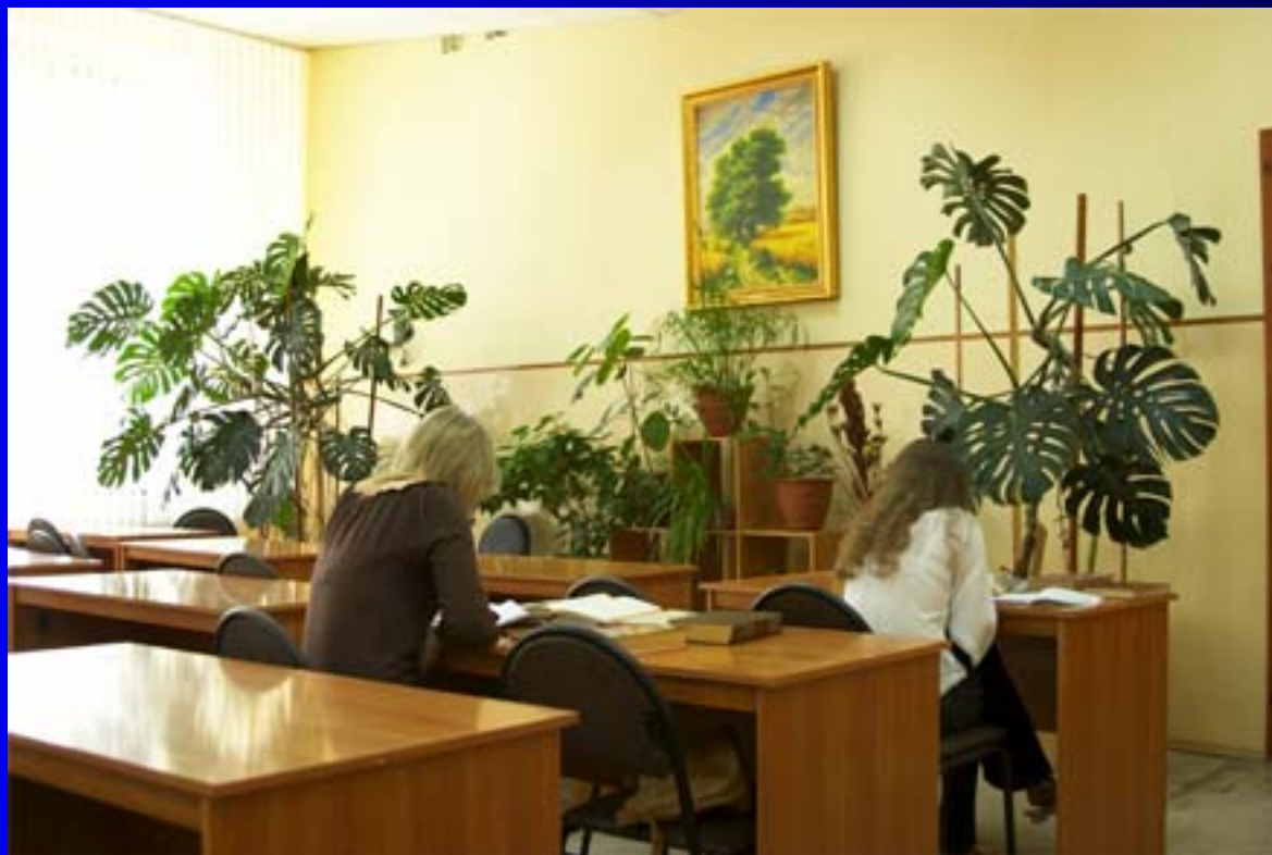
Читальный зал в главном корпусе