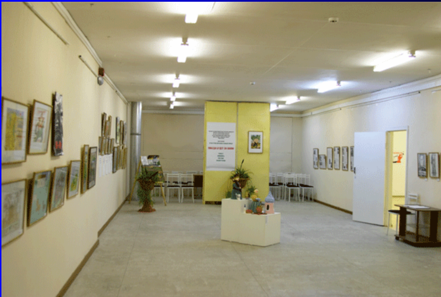
Холл «Картинной галереи». Учебный корпус № 8.