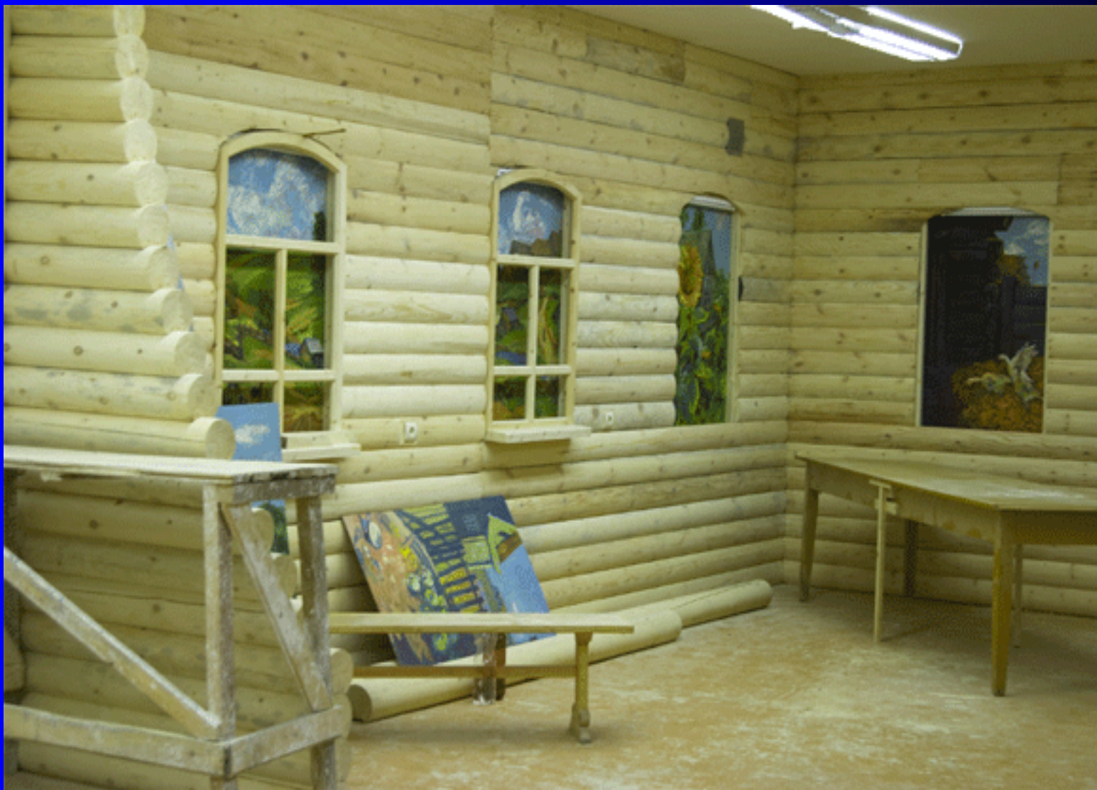
«Русская изба в Сибири». Учебный корпус № 8.