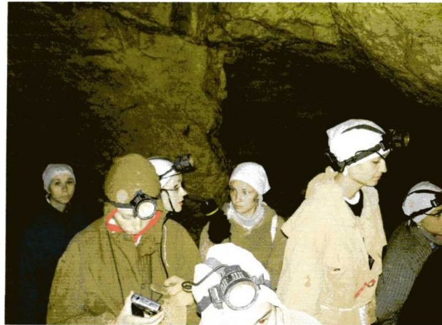
В пещере «Партизанская»

До пещеры «Партизанская», которая находится в глухой Саянской тайге, в 90 км от г. Красноярска, 3 часа добирались автобусом по горной дороге. Затем, облачившись в рабочую одежду и нацепив фонарики на голову, прошли по лесу 2 км и увидели вход в пещеру – небольшой провал в земле, среди непроглядной тайги. Под руководством инструктора-спелеолога спустились в темноту, холод и сырость. На поверхности температура воздуха составляла + 30 ° С, а внутри всего + 3 ° С. Путешествуя в течение 2,5 часов по подземным переходам и галереям, спустились на 50 м ниже земной поверхности, увидели сталактиты и сталагмиты, убедились в карстовом происхождении пещеры.