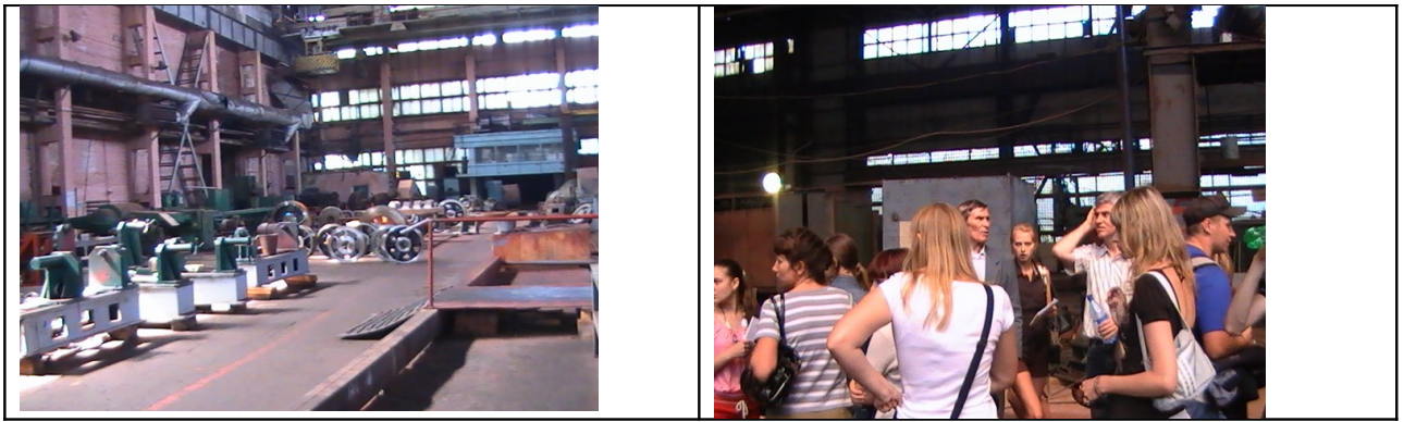
В цехе сборки завода «Сибтяжмаш»

На фабрике игрушек «Бирюсинка» студенты увидели, как делают стеклянные елочные игрушки и украшения, в в цехе росписи даже попробовали сами красить игрушки. Мастера-художники, исходя из пожеланий ребят, делали надписи на шарах. Еще мы были в цехах, где наблюдали процесс превращения ткани и резиновой массы в красочные игрушки.