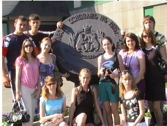
У памятника пивной пробке на территории завода «Пикра»

При посещении предприятия пищевой промышленности «Пикра» студенты с любопытством заглядывали в чаны брожения и вдыхали хлебный аромат, следили за автоматизированной линией розлива и упаковки пива.