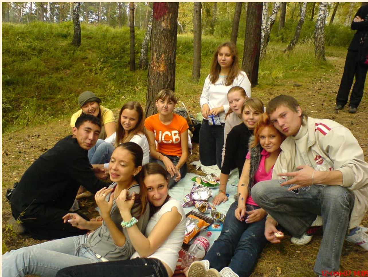
Фотографии 3 и 4. Гр. 273 на посвящении в студенты