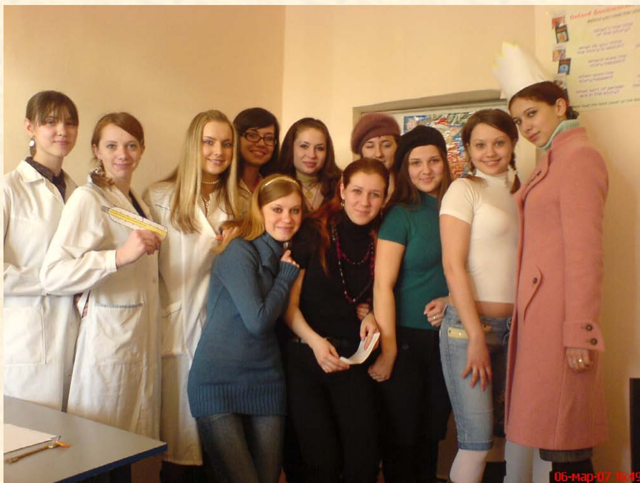
Фотография 1. Гр.263 готовится к выступлению на заседании разговорного английского клуба