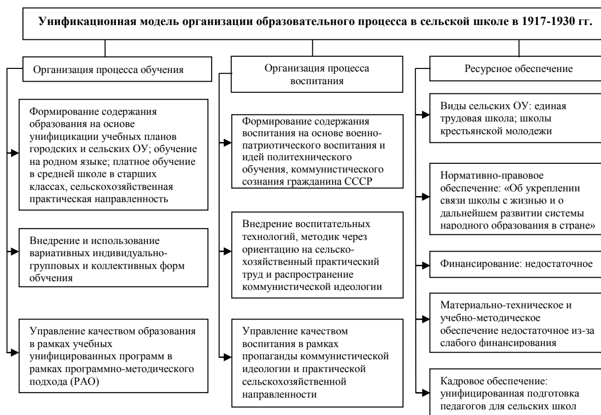
Рисунок 2 – Унификационная модель организации образовательного процесса в сельской школе в 1917 – 1930 гг.

II. Унификационная модель организации обучения была представлена в классической форме, а также унификационной моделью с элементами дифференцированного обучения, складывалась в рамках следующих этапов советского периода становления сельской школы: период унификации образовательной системы (1917–1930 гг.), период апробации идей политехнической школы (1940–1950-е гг.), период внедрения идей производственного обучения и элементов дифференцированного образования (1960–1991 гг.). Она представлена совокупностью видов управленческой деятельности в области образовательного процесса, направленной на использование идей единой трудовой школы, типового программно-методического сопровождения, подготовку сельскохозяйственных работников, организацию коммунистического воспитания личности в рамках недостаточного ресурсного обеспечения и малоэффективной единообразной кадровой политики (см. рис. 2).