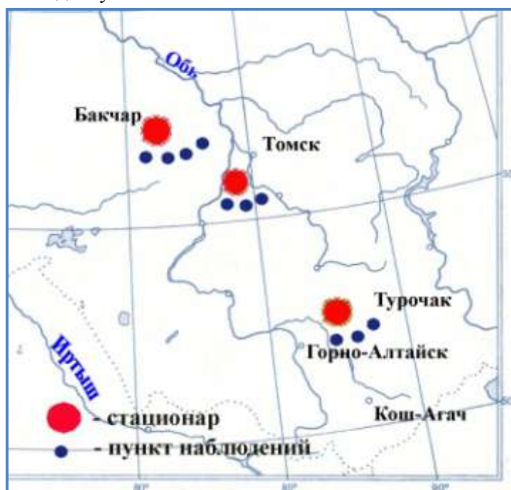
Рис.1 - Болотные стационары и опорные пункты мониторинга режимов болот в южно-таежной подзоне Западной Сибири и в Республике Алтай