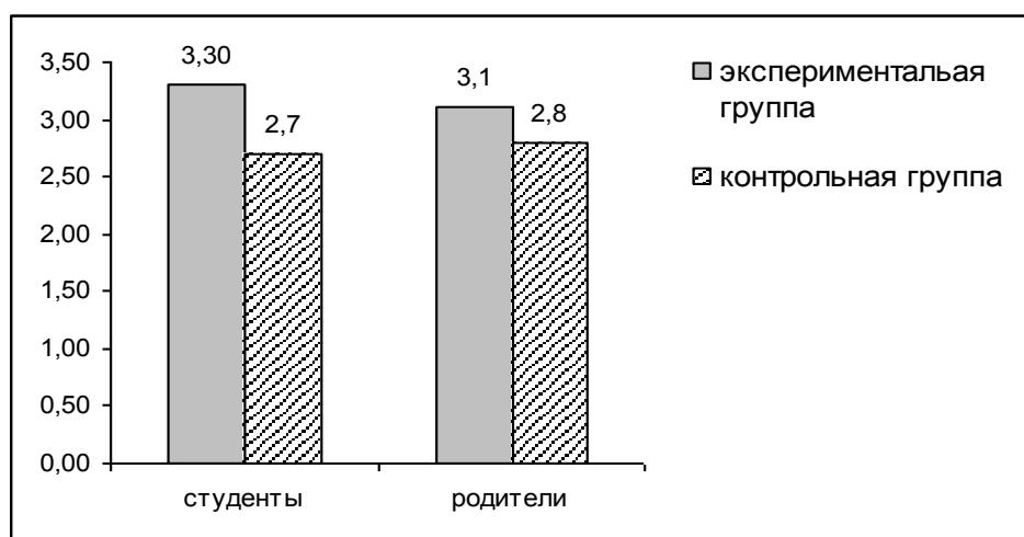
Уровень удовлетворённости жизнью техникума.

Коэффициент удовлетворённости жизнедеятельностью учебного заведения по формированию личностных компетенций экспериментальной группы составил 3,3 балла, что соответствует высокой степени удовлетворённости, тогда как в контрольной группе коэффициент составил 2,7 балла, что соответствует средней степени удовлетворённости