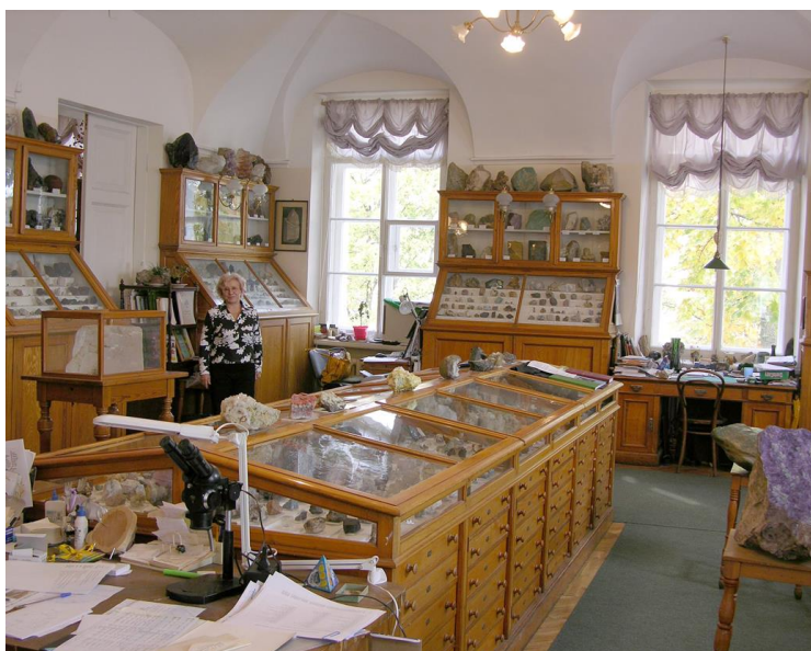
Минералогический музей Санкт-Петербургского государственного университета в историческом здании Двенадцати коллегий

В рамках конференции планируется обсудить фундаментальные и прикладные вопросы современной минералогии и смежных наук: